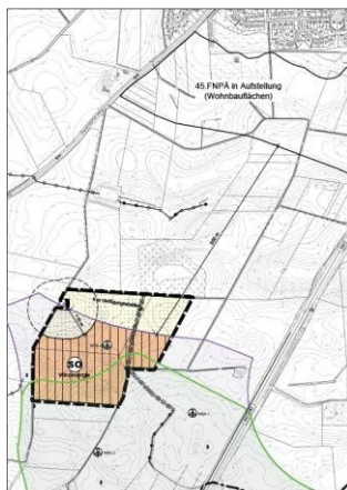
Abbildung 1: Abgrenzung des Geltungsbereichs der 52. Änderung des Flächennutzungsplanes der Stadt Heiligenhafen

Im aktuellen Entwurf der Teilfortschreibung zum Thema „Windenergie an Land“ des LEP Schleswig-Holstein - Fortschreibung 2021 - Änderung Kapitel 4.5.1 (Zweiter Entwurf April 2025) ist der Bereich als Potenzialfläche (PR3_OHS_094) dargestellt. Im aktuell rechtskräftigen Regionalplan für den Planungsraum III (2020) liegt der Bereich nordwestlich des Vorranggebietes PR3_OHS_010. Dort sind bereits 2 WEA errichtet.