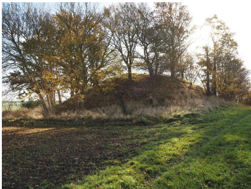
Abb. 1: Detailaufnahme des „Stuckberg“ nach Süden.