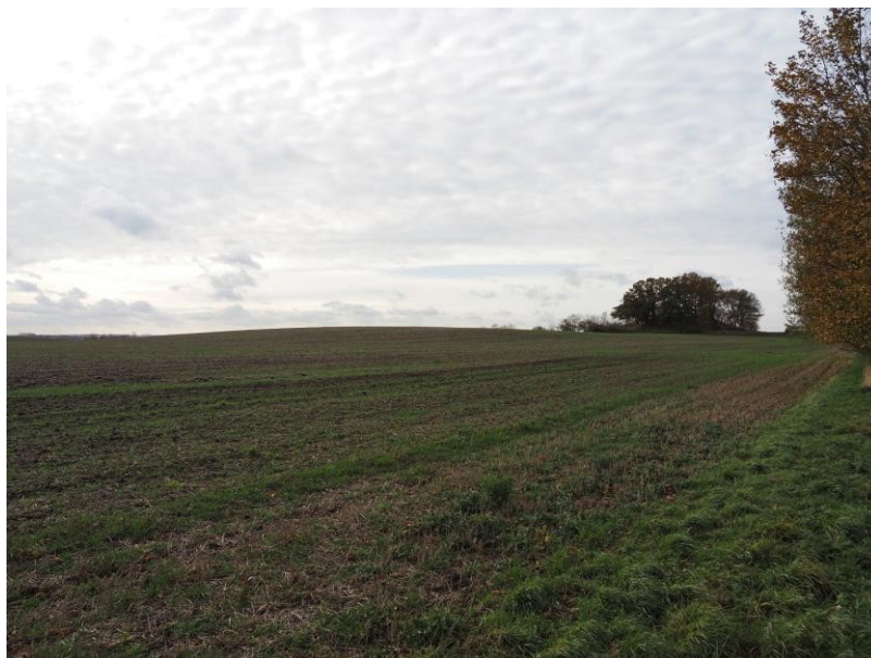
Abb. 5: Sicht nach Westen vom Großsteingrab LA 132 aus.