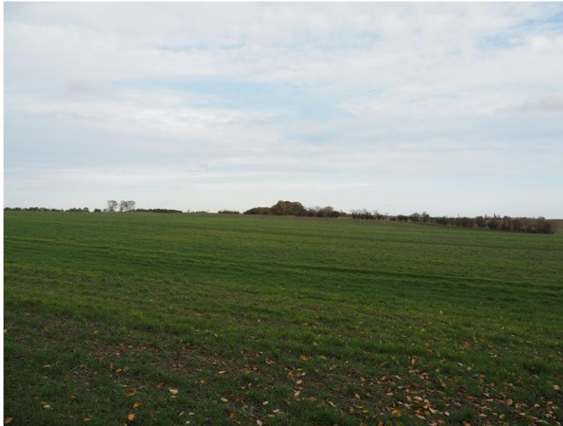
Abb. 3: Sicht nach Nordosten vom „ Tweltenberg “ zum „ Stuckberg “.