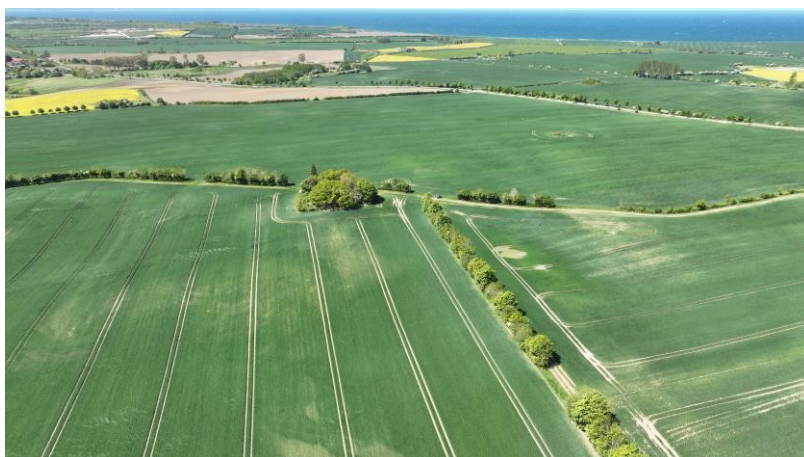
Abb. 7: Drohnenfoto der Sichtbeziehung vom „Stuckberg“ zum „Tweltenberg“ (links oben) und dem „Kremper Berg“ (rechts oben).

Für die Wahrung der Schutzwürdigkeit des Denkmals ergibt sich eine Schutzzone um den „Stuckberg“, die in Richtung der WEA 4 200 m beträgt (Karte 1, Abb. 7). Die Schutzzone ergibt sich dabei aus dem scharfen Sichtfeld des Menschen und ist hier in Blickrichtung auf den Grabhügel zwischen 70° und 110° aufgespannt worden. Maßgeblich für den einzuhaltenden Abstand ist hierbei nicht der Mittelpunkt der Anlage, sondern die Außenkante der Rotorblätter. Bei einem Rotordurchmesser von 180 m ist somit ein Mindestabstand von 290 m zwischen Anlagenmittelpunkt und Grabhügel einzuhalten.