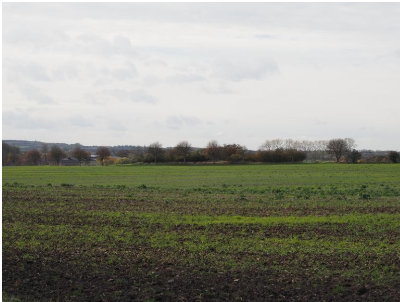
Abb. 4: Sicht nach Südwest vom „ Stuckberg “ auf den „ Tweltenberg “.