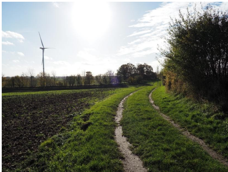
Abb. 6: Der „Stuckberg“ vom Feldweg nach Süden aus zu sehen.

Der vorhandene Rastplatz an der K 41 sowie eine Parkbank in Richtung A 1 und die landschaftliche Einbettung unterstreichen den Naherholungscharakter der Umgebung (s. Karte 1); eine gesonderte Beschilderung ist für die Erschließung des Denkmals nicht erforderlich. Der „Stuckberg“ bleibt auch aus größerer Entfernung klar wahrnehmbar (Abb. 5 und 6).