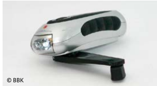
Eine Taschenlampe mit Handkurbel kann bei Stromausfall hilfreich sein.