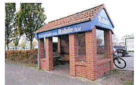
ÖPNV + Bike-Stationen entwickeln