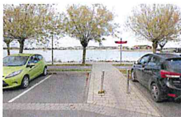
Anbindung Binnensee stärken