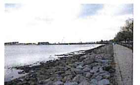
Promenade stärker anbinden