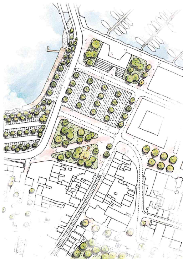
Skizze Option Platzgestaltung