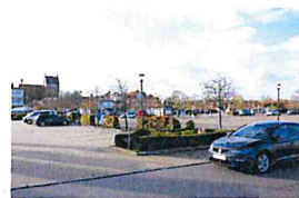
Stellplätze für wen und wieviele?