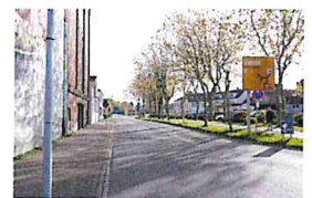
Kreisstraße oder „Stadtboulevard“